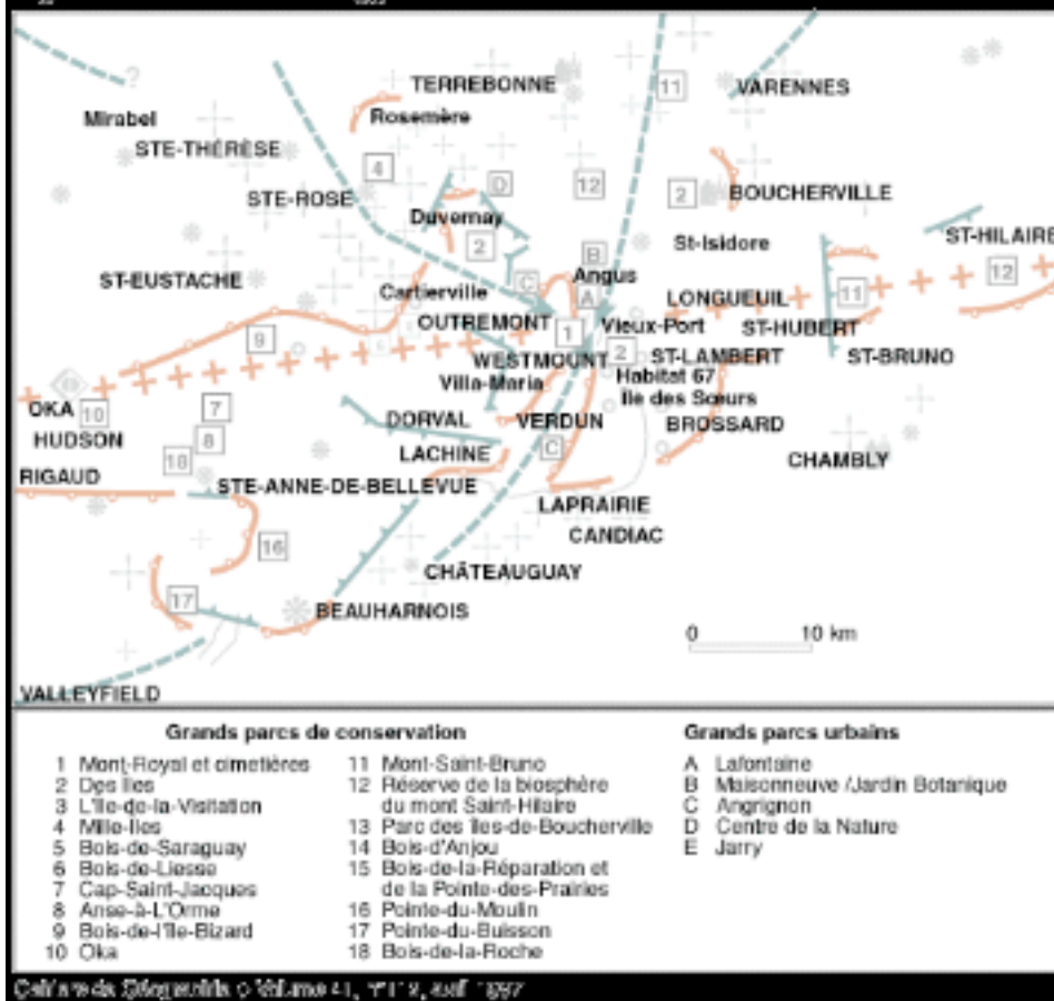
Figure 2 Localités de l'agglomération de Montréal

Carte de Géographie • Vol. no 41, n°112, août 1987